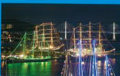
ライトアップイルミネーション