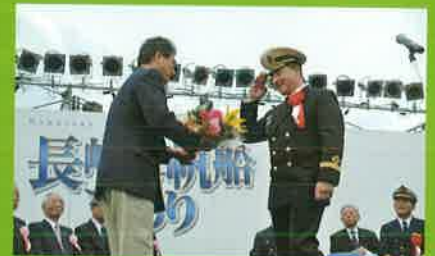
入出港セレモニー