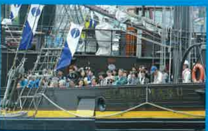
体験クルーズ(観光丸)