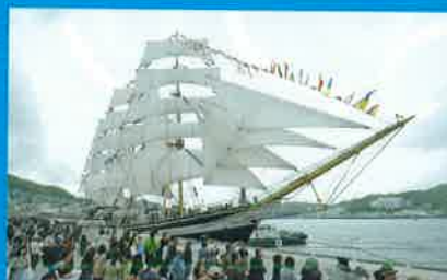
セイルドリル(操帆訓練)